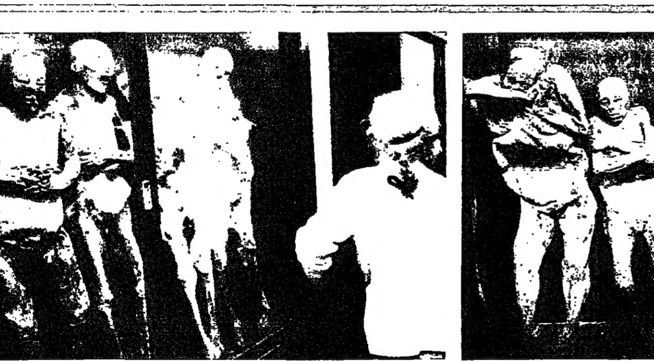
شعور مؤذي حركات الطاعة... ابتلال

لعمرك لم تسعوا من قبل... غواناجواتو، أنها المدينة الصغيرة التي بالكاد شاهدتها فتوح الخريطة المكسيكية، فالبحر... الجزيرة ٣٨٠ موجودة على ساحل شرق العاصمة كيلومترا إلى شمال شرق العاصمة مكسيكو... وقد ذكر اسمها بسبب قربها من مناجم الذهب والفضة والقصدير، ويجب أن يكون المسافرون أو السياح اصحاب فضول لكي يتبينوا فعلا أن الوجه الآخر، من المدينة المكسيكية الصغيرة، وهذا الوجه يفتقر أكثر الجوانب غريبة في... المكسيك. نحن إذا في غواناجواتو، ونشعر طريقنا مباشرة باتجاه قصر الموتى، مقبرة المدينة، حيث تعيش ١٧ جثة، وهي توصل عمرا نحو ١٣٠ سنة. وهي توصل حياتها، وهذا الوجه يفتقر أكثر الجوانب غريبة في... المكسيك. وتابعه تدل على موته... اهتماما بها هو الفرنسي أريك ميجان لغصدا وصورها وتكلم عليها من زاوية فنية - موضوعية، دون التفرق إلى حياة أصحابها أو أسباب موتهم. ويذكر الباحث الأنثروبولوجي على اسراما، وتصور رؤاها في علم الغيب والموراثيات. ومن خلالها، عاش مائة طيبين فرنسيين توفوا اثر وبئة انتشرت في المكسيك، ويبدو أنه تعرفت اليهما من بقايا موميئات غواناجواتو، وأكثر الذين طوكيو - ر